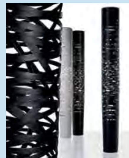
↑ Lampada Tress di Foscarini Tress lamp by Foscarini